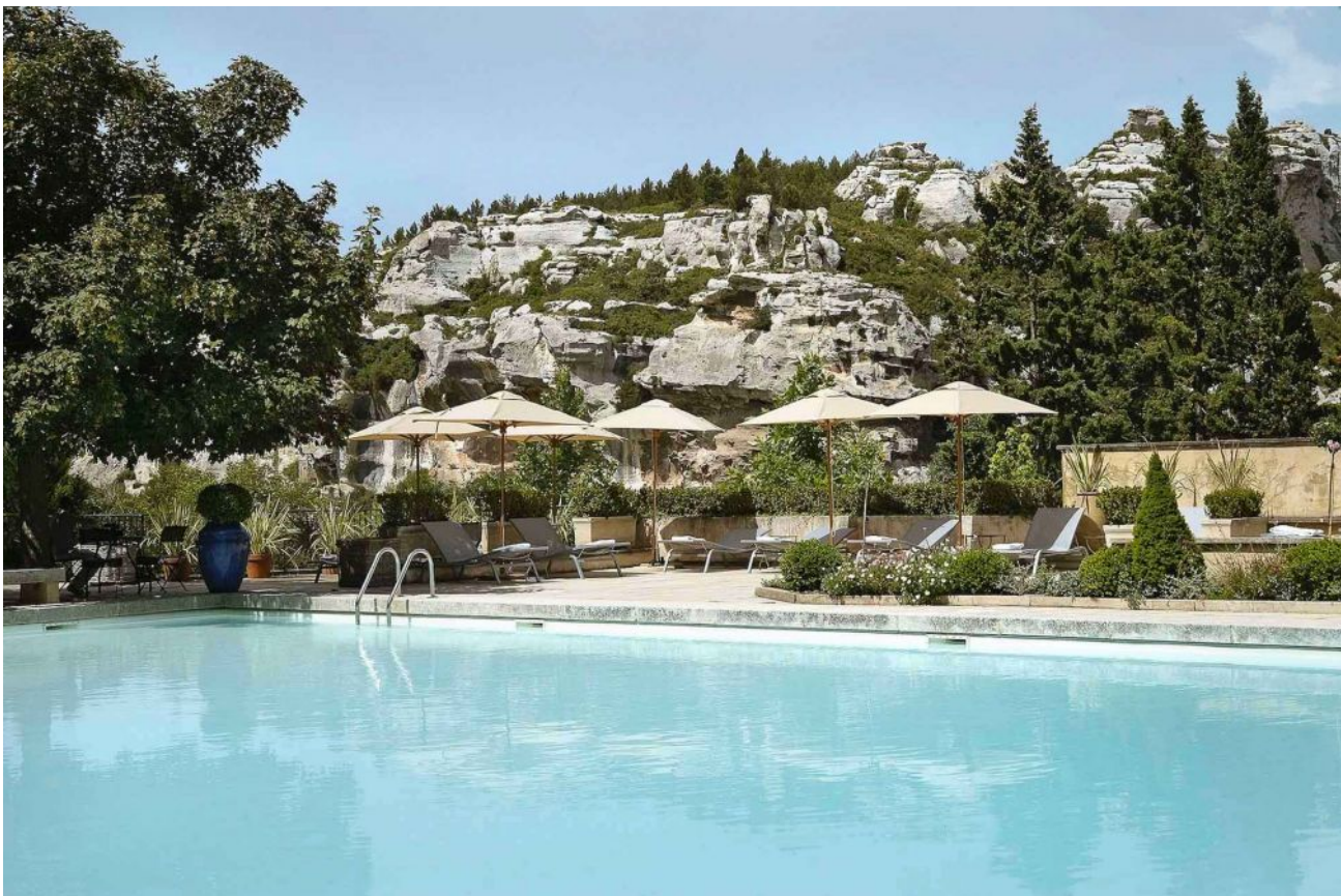
Baumannière aux Baux-de-Provence, une adresse mythique © L. Parrault.

Si le romantisme n'a plus toujours bonne presse, découvrez ici notre sélection des plus belles escapades à faire en duo. Adresses confidentielles, luxueuses, branchées ou gourmandes, exclusivement en France, et surtout loin des clichés !